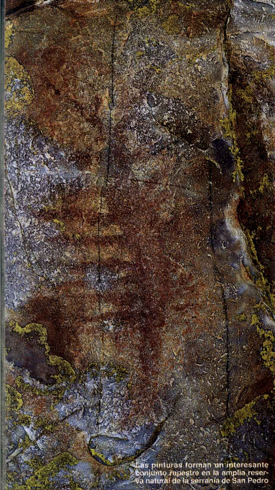
Las pinturas forman un interesante conjunto rupestre en la amplia reserva natural de la sierra de San Pedro