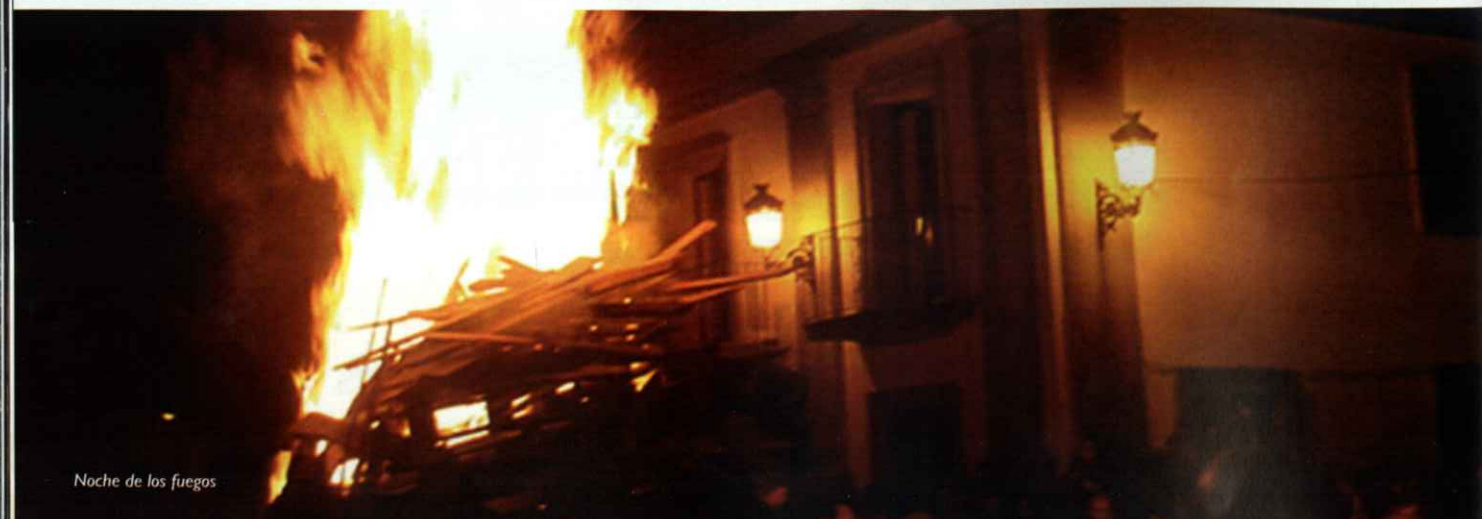
Noche de los fuegos

www.sanvicentedealcantara.es | www.mancomunidadsierrasanpedro.com