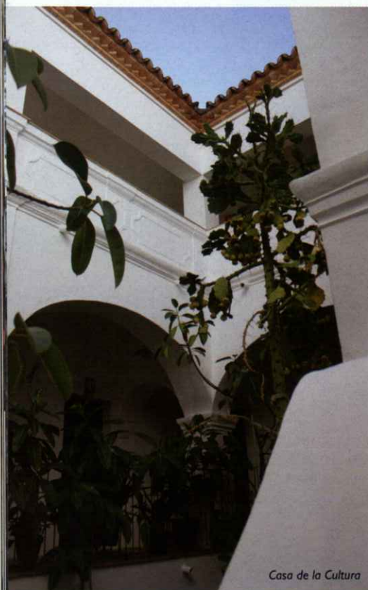
Casa de la Cultura

Pedro está declarada Zona de Especial Protección de Aves (ZEPA).