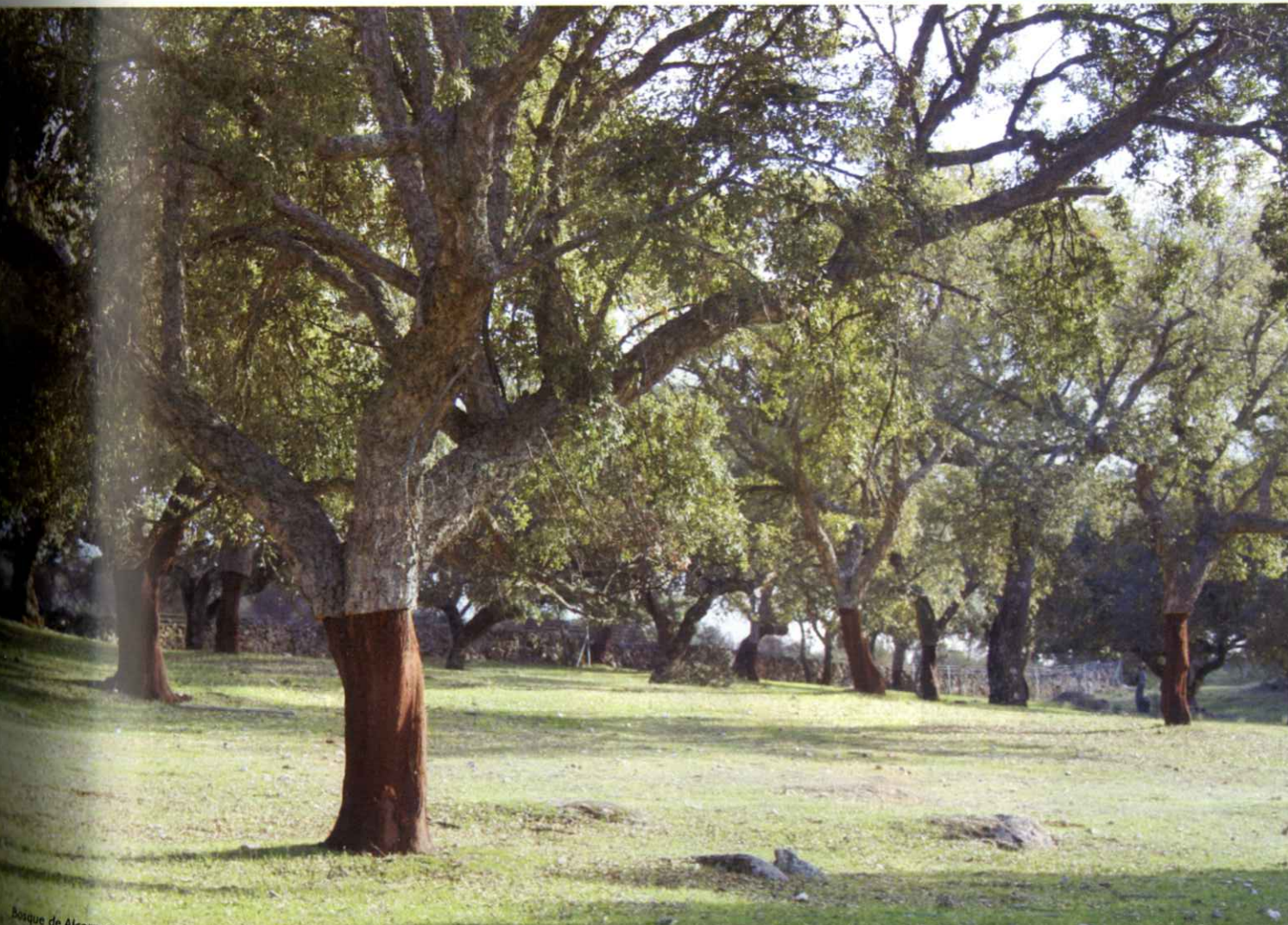
Bosque de Alentejo