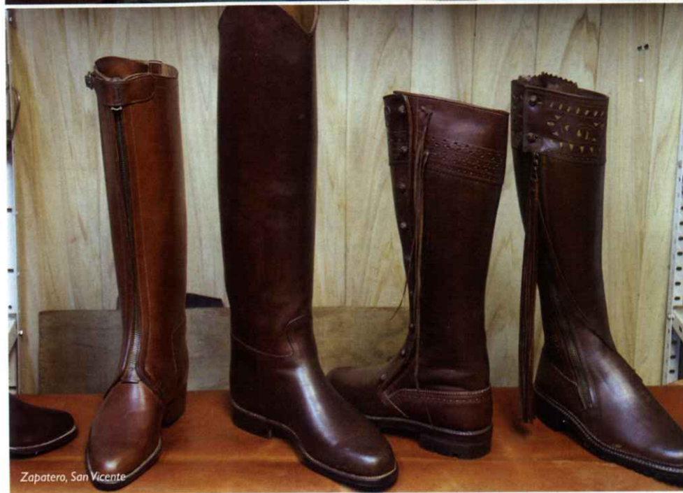
Zapatero, San Vicente

Y es que la actividad del corcho en San Vicente de Alcántara se remonta a 1858 cuando se abre la primera fábrica en la localidad.