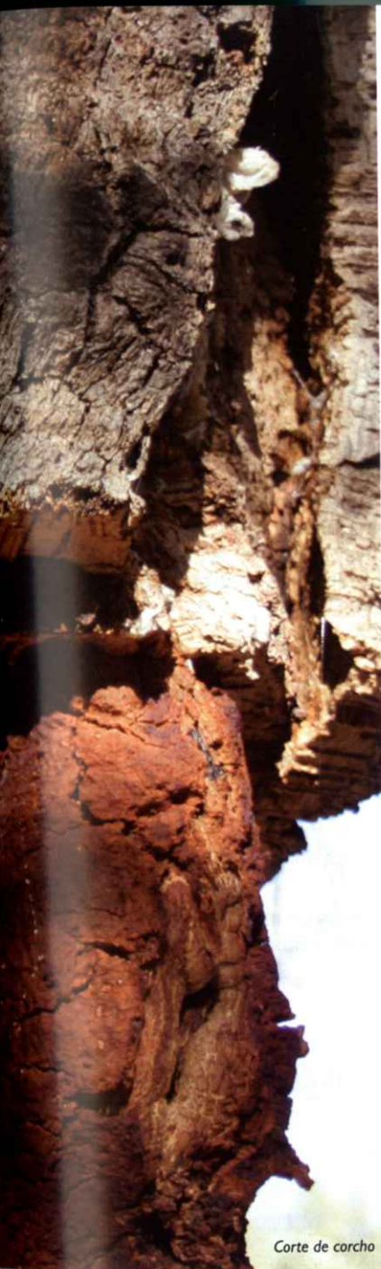
Corte de corcho