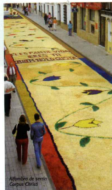
Alfombra de serrín Corpus Christi

Los sanvicenteños guardan durante todo el año el serrín, con el que